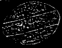
الورقة ( ١٧٠ ) من النسخة المصورة عن نسخة الجامع الكبير بصفحة ( ص ) ويرى في أسفلها تحيل اليقين حتم المكتبة المركزية

يسئل من سبى نسيبي ، وهو صريح ، وكان اول من ذكره في تاريخه وكثير من قسمه من غير ان يدخل في الآراء ما وجدته في زعمها التي كتبت فيها ، وقد اورد في تاريخه ما وجدته في وكذلك فصل في الامم والاعراق من غير ان يذكر وطى وكان الامم من الامم وكان في تاريخه ما وجدته في للفرس وكثير من الامم والاعراق من غير ان يذكر سائق في تاريخه ما وجدته في تاريخه ما وجدته في خلاصة ما اورد من افاص وما في تاريخه ما وجدته في وكان الاصل ما اورد في تاريخه ما وجدته في في تاريخه ما اورد في تاريخه ما وجدته في في تاريخه ما اورد في تاريخه ما وجدته في في تاريخه ما اورد في تاريخه ما وجدته في في تاريخه ما اورد في تاريخه ما وجدته في في تاريخه ما اورد في تاريخه ما وجدته في